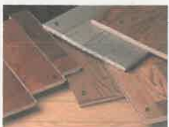
天然目化粧複合フローリング

写真上段 110(巾)×15(厚)杉単層 中段 150(巾)×35(厚)杉厚板 下段 215(巾)×30(厚)杉厚板