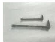
カジヤ(中と小サイズ)

家屋の解体など長い釘を抜く場合は、長い平パールが必要です。平パールは大型の釘抜きで、L型の方の釘抜きは回転半径が大きく、てこの働きが使えるので長く太い釘など抜くことができます。もう一方の薄く平たい形状の先端部はモノを持ち上げたり、こじ開けるのにも使えます。