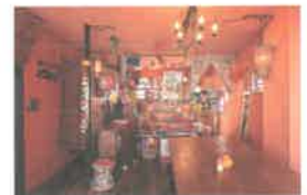
天井と壁をDIYで満足のイメージに