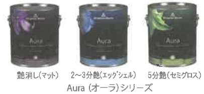
艶消し(マット) 2~3分艶(エッグシェル) 5分艶(セミグロス) Aura (オーラ) シリーズ

ベンジャミンムーア総輸入販売元 B.M.ジャパン株式会社 テクニカル&プロモーションマネージャー 長張敏明