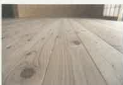
杉単層フローリング