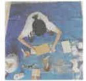
端材を使ってDIYでオリジナルテーブルに

私も自宅に棚を作りました。大工さんなら3分で出来そうなところを半日かけて。物を作るのは好きです。自分の家なら出来るのです。自分で納得しているから楽しいです。でも人の家なら責任もあるし、きれいにしたい。「DIYリフォーム」のメリット・デメリットをきちんと確認してアドバイスを心掛けることが大事だと思います。この前、全くDIYリフォームに興味がないお客さんに完成間近で「思い出づくりをしませんか?」と、ちょっとだけDIYしてもらいました。愛着をもってもらえれば、と思い込めて。