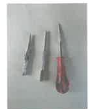
いろいろなセンターポンチ

単層フローリングを張る場合、フロアネイルを使って施工するときには、釘メを使うよりセンターポンチを使う方が失敗なく正確にフロアネイルが打込めます。N釘の釘頭はフラットですが、フロアネイルの釘頭は小さく中央に凹部があるので、先端のとがったポンチの方がズレなくて正確に打てます。釘メは細くなった先端が小さな面になっています。