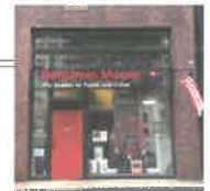
青山フラッグシップショップ

詳しくは、ホームページをご覧ください http://benjaminmoore.co.jp/