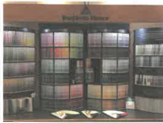
青山フラッグシップショップ:店内